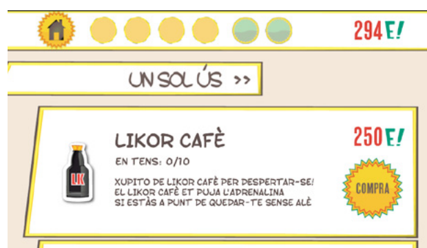
Botiga d'ítems per equipar els personatges!

"Es tracta del projecte més creatiu en el que hem participat fins aquest moment . He pogut exercir d'il·lustradora i directora d'art creant personatges, escenaris, ítems,... Ha estat una experiència genial i és un dels projectes que més orgullosa em fa sentir."