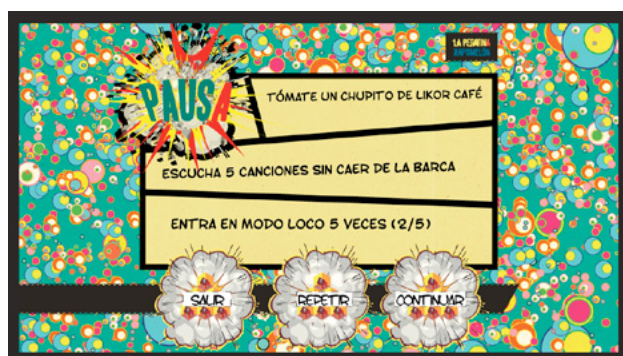
Menú de pausa del escenario Xapomelön

“Se trata del proyecto más creativo en el que hemos participado hasta este momento . He podido ejercer de ilustradora y directora de arte creando los personajes del juego, los escenarios, los ítems, el menú... Ha sido una experiencia genial y es uno de los proyectos que más orgulloso me hace sentir.”