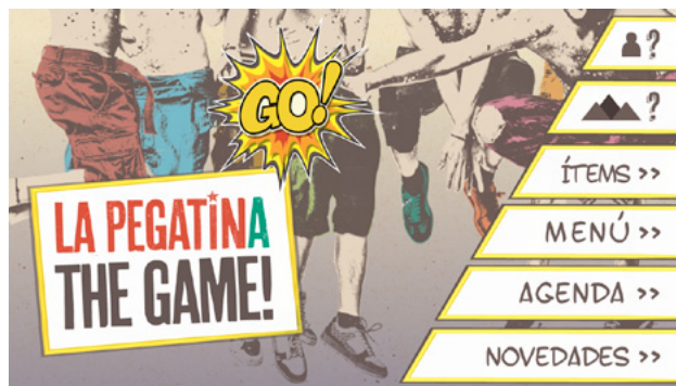
Menú inicial donde podremos escoger personaje, escenario,...

‘La Pegatina, The Game’ es, hasta el momento, el proyecto más grande en el que Ubicuo Studio ha trabajado y el proyecto que más orgullosos les hace sentir.